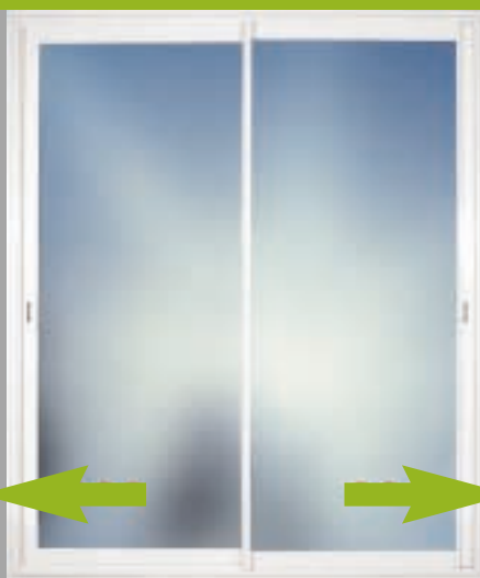
Coulissant aluminium 2 vantaux à galandage