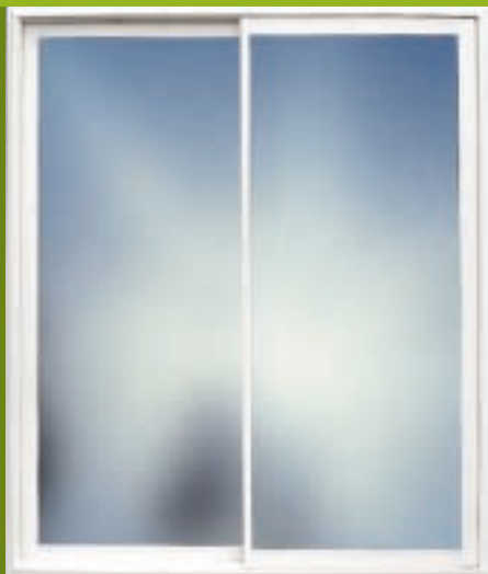
Coulissant aluminium 2 vantaux