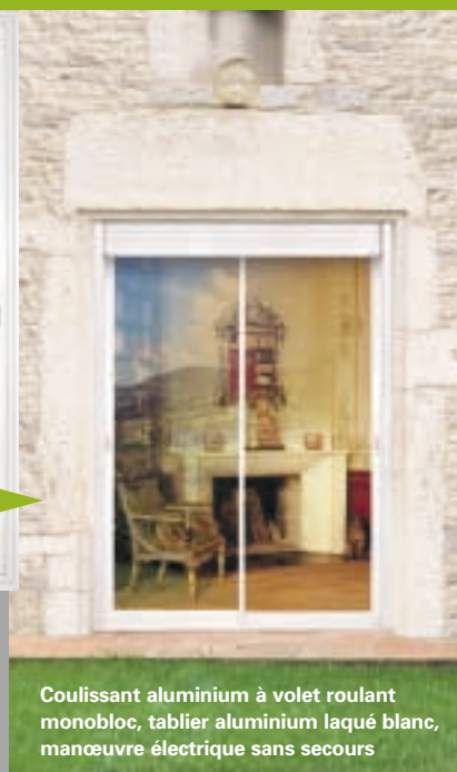
Coulissant aluminium à volet roulant monobloc, tablier aluminium laqué blanc, manœuvre électrique sans secours