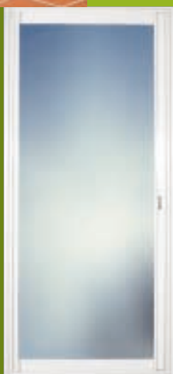
Coulissant aluminium 1 vantail à galandage